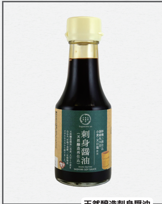
天然醸造刺身醤油